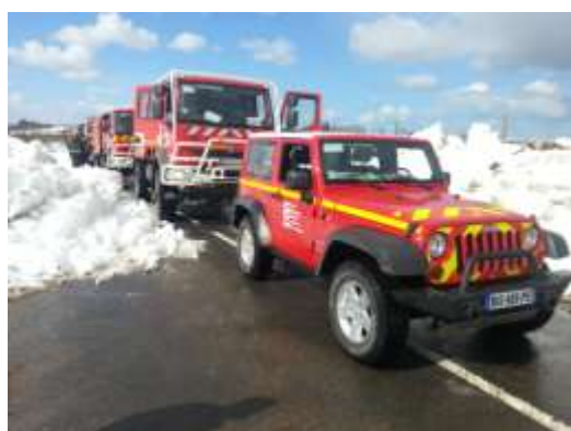
Nous franchissons des murs de neige. Nous arrivons sur une portion de route enneigée bloquée par un tractopelle. Deux de nos CCF contournent prudemment l'engin, le troisième s'embourbe. Nous mettons en place une longe pour sortir le camion.

« Nous discutons avec les locaux. Ils nous racontent leur galère, leurs peurs , et c'est là que nous prenons conscience de la frayeur qu'ils ont eu ! »