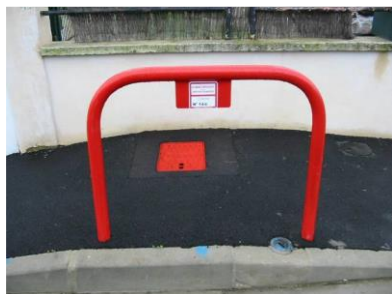
B.I avec dispositif de protection